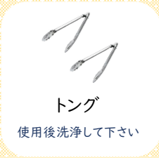
トング 使用後洗浄して下さい