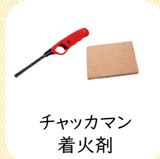
チャッカマン 着火剤