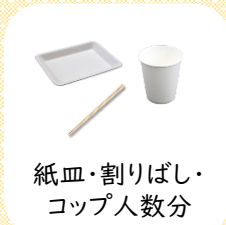
紙皿・割りばし・ コップ人数分