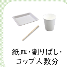
紙皿・割りばし・ コップ人数分