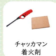
チャッカマン 着火剤