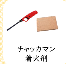
チャッカマン 着火剤