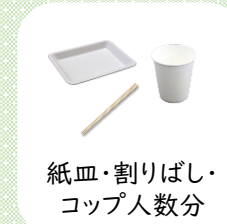
紙皿・割りばし・ コップ人数分