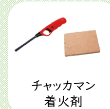
チャッカマン 着火剤