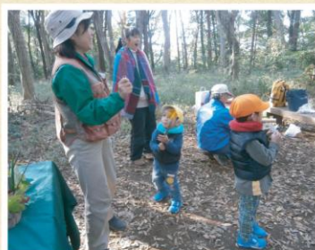
森のネイチャーゲーム 11/16