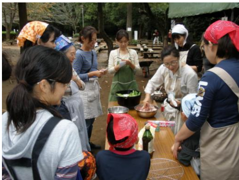
森のアトリエ「ダッチオープン」

親子で共同して調理の準備をして、料理を作りました。みんな笑顔の野外料理となりました。